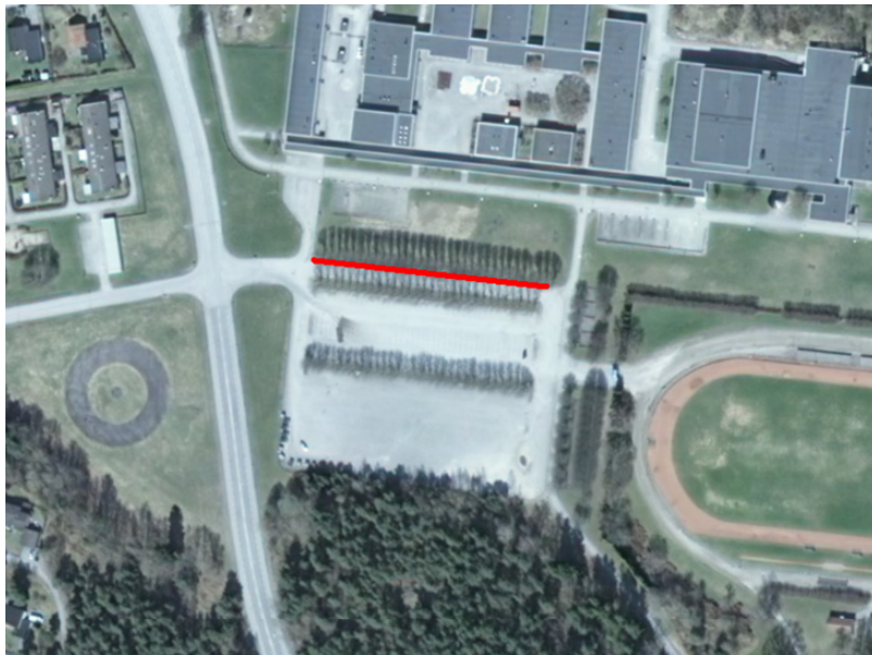
Figur 2. Flygbild