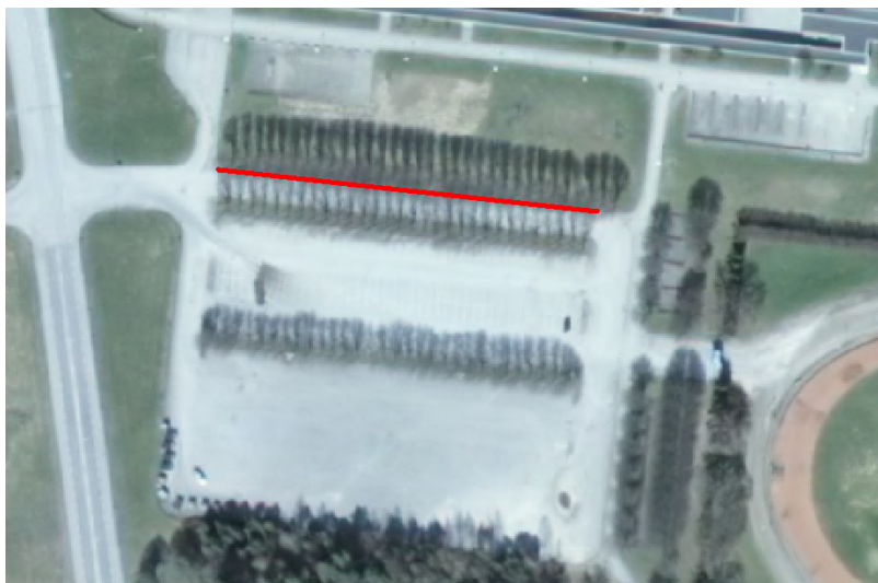
Figur 3. Inzomad flygbild

Denna författning träder i kraft den 13 december 2011.