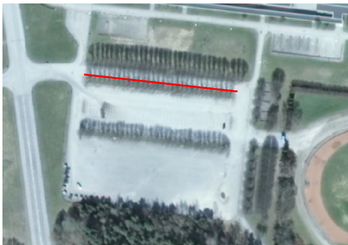
Figur 3. Inzomad flygbild

Denna författning träder i kraft den 13 december 2011.