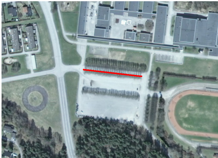
Figur 2. Flygbild