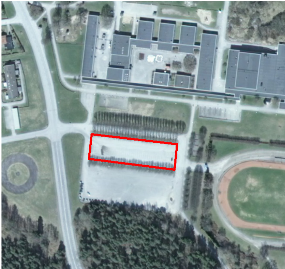
Figur 2. Flygbild

Denna författning träder i kraft den 13 december 2011.